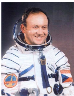
Československý kosmonaut Vladimír Remek.