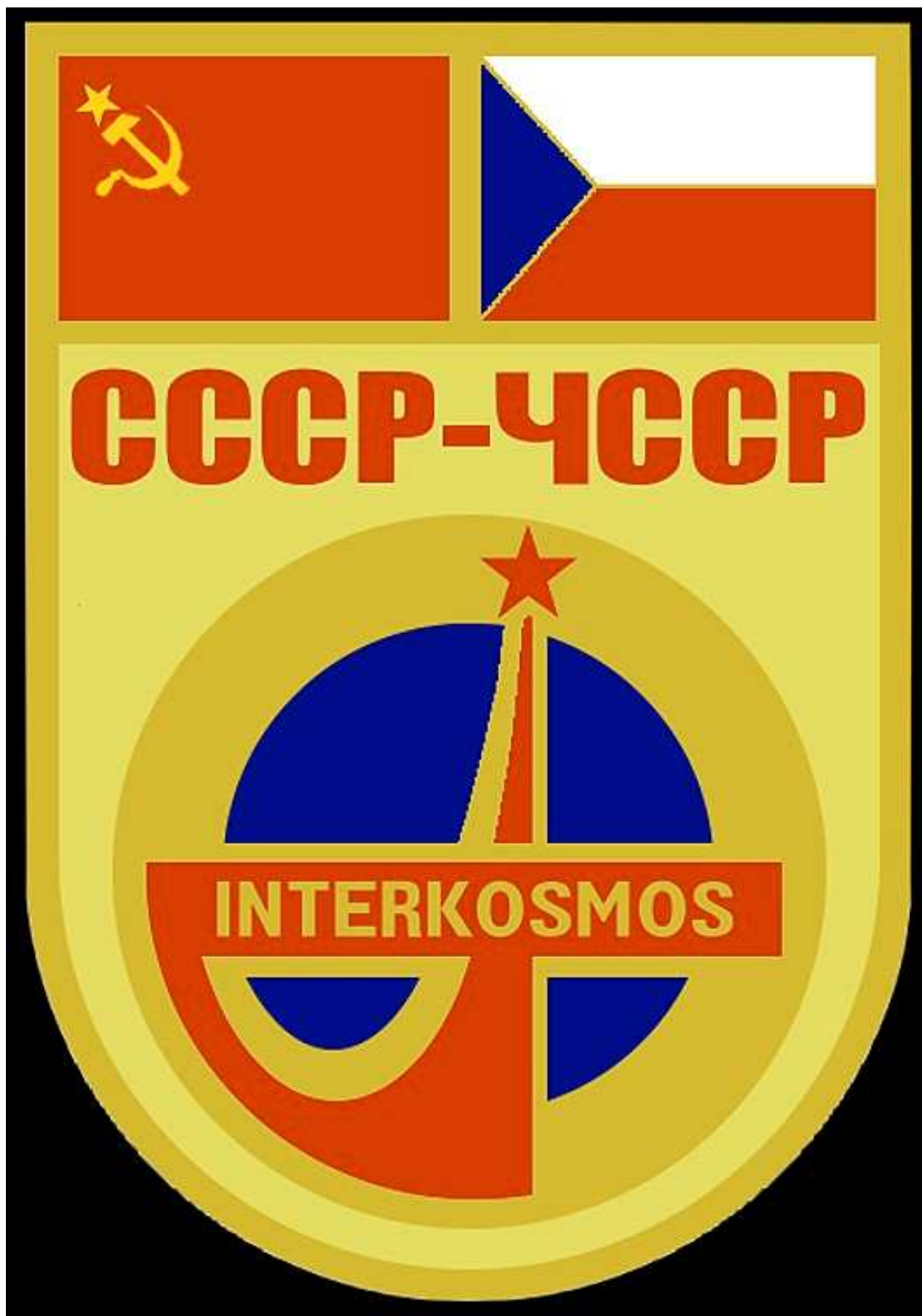
Logo mezinárodního kosmického letu ČSSR-SSSR v programu Interkosmos.