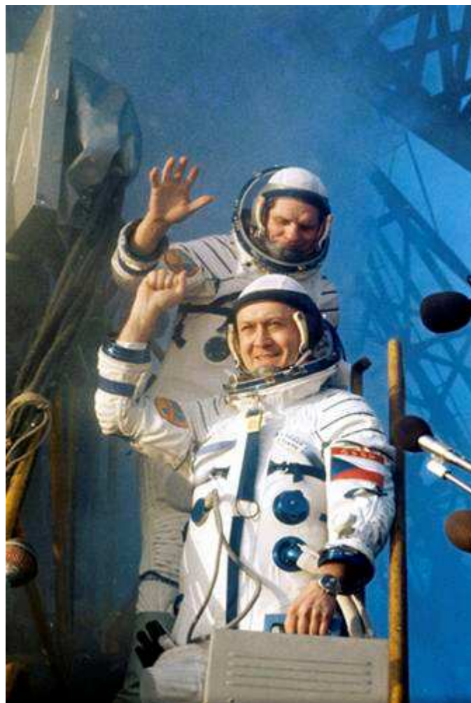
Poslední pozdrav před startem.