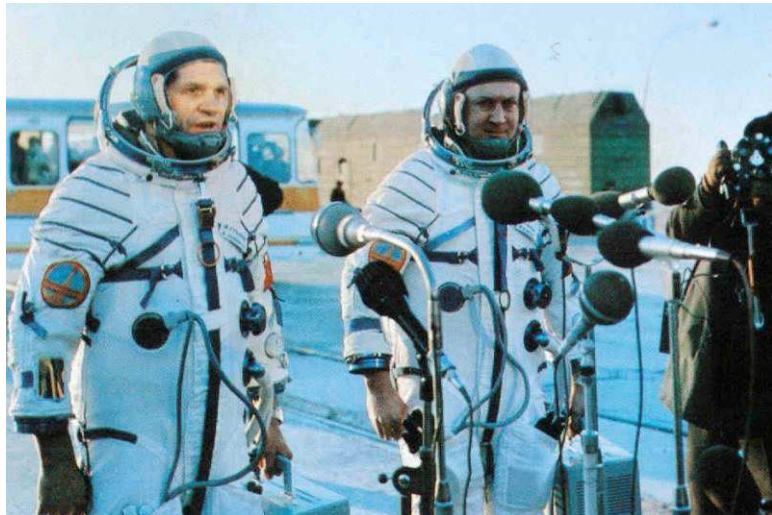
Hlášení posádky o připravenosti ke startu.