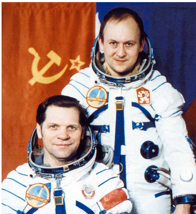
Oficiální portrét posádky Sojuz 28 - vlevo Alexej Gubarev (velitel), vpravo Vladimír Remek (kosmonaut-výzkumník).