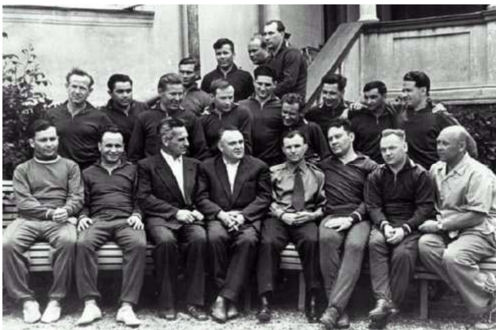
První oddíl sovětských kosmonautů (1961) – Jurij Gagarin čtvrtý zprava v první řadě, vedle něj „Hlavní konstruktér“ Sergej Koroljov (pátý zprava).