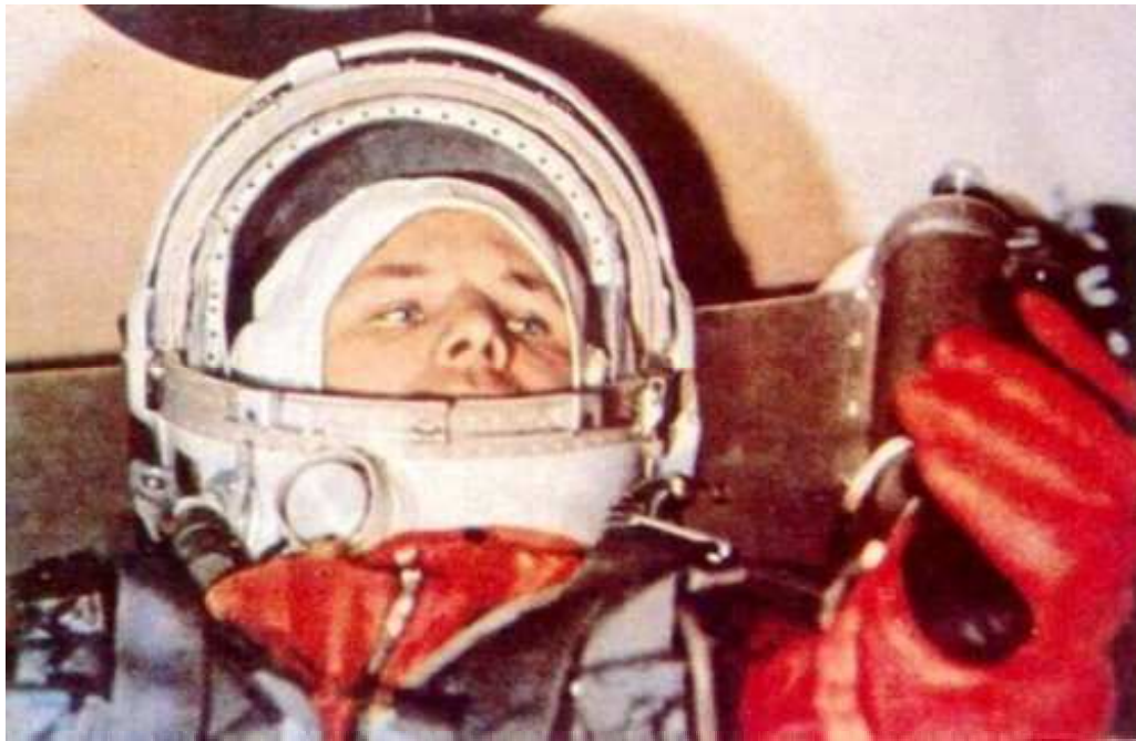
Jurij Gagarin v kabině kosmické lodi Vostok-1 (12.4.1961).