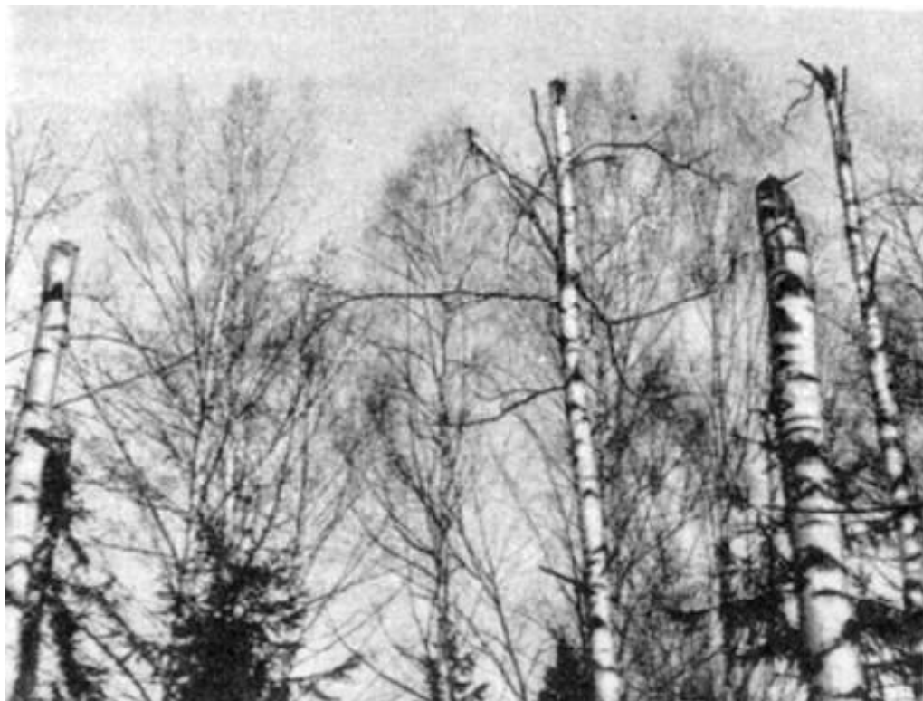
Do dnešních dnů jsou v místě havárie vidět uražené vršky bříz...