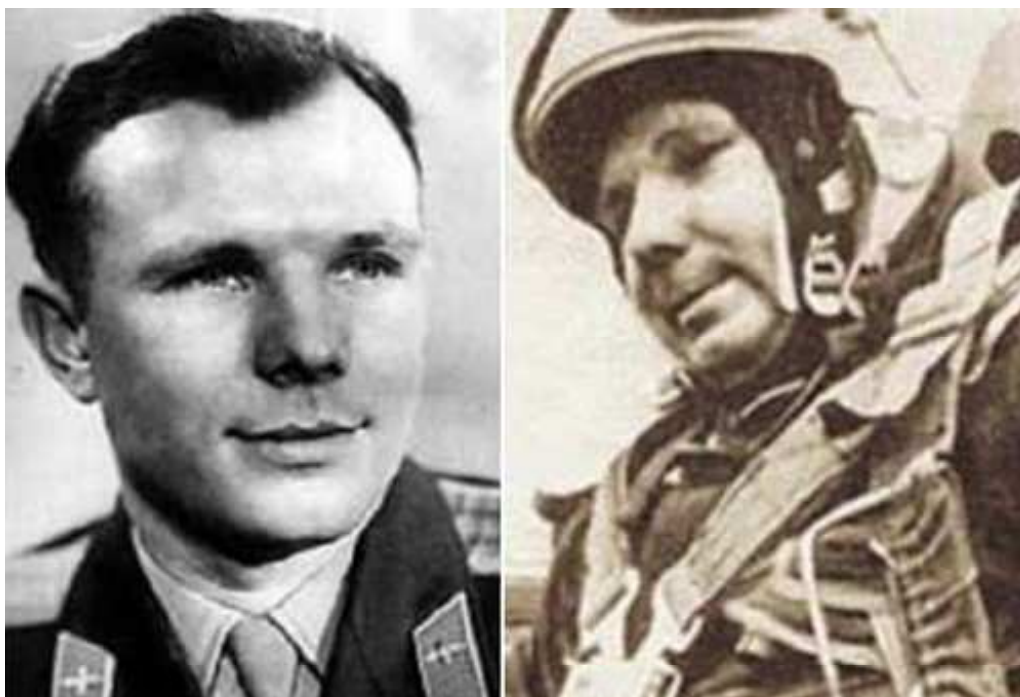
Jurij Gagarin v roce 1961 po svém kosmickém letu a v roce 1968 před tragickou smrtí.